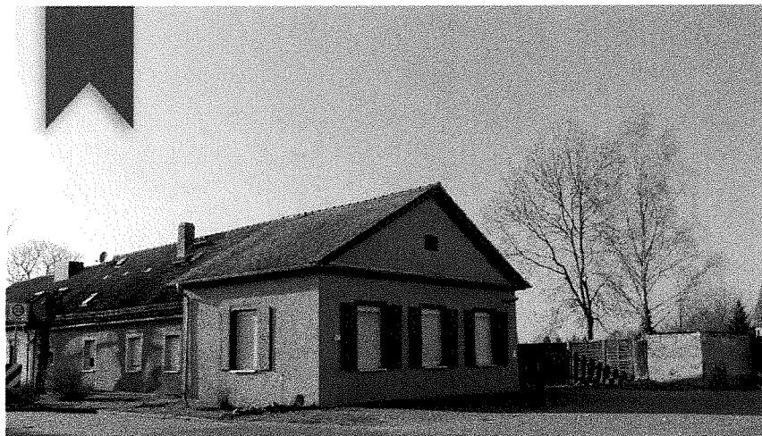
Abb.69 Beispiel: Leerstandsobjekt zur Installation eines 'GRÜNDERzentrums'

Das Innutzungbringen kommunaler Leerstandsobjekte zu sog. 'GRÜNDERzentren' soll zu einer Belebung der Ortsmitten beitragen. Auch kommunale Objekte mit noch vorhandenen Raumkapazitäten (Dorfcommunityshäuser, etc.) können hierfür genutzt werden. Neugründer können über eine zeitlich begrenzte Nutzungsüberlassung hier ihre Gründungsidee ausprobieren und umsetzen.