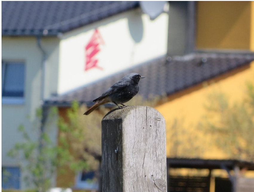
Abb. 6: Hausrotschwanz leicht außerhalb des UG aufgenommen (nordöstliche Weide an der Straße)