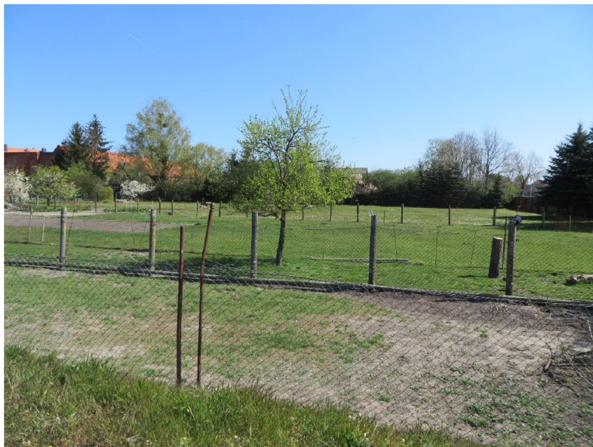
Abb. 2: Grünlandbereiche und Gehölze im UG