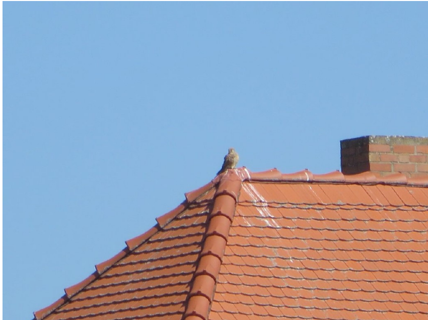
Abb. 4: Turmfalke auf dem Dach eines Gebäudes im UG

Turmfalke ( Falco tinnunculus ) Die Art war fast ständig im UG zu beobachten. Ein Paar dürfte hier in der Gebäudesubstanz brüten, der genaue Niststandort konnte nicht geklärt werden. Die vorhandenen Bäume sind nicht als Brutbäume in Nutzung.