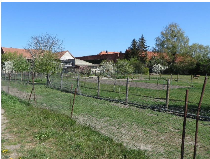
Abb. 3: Von Hühnern genutzter Gartenbereich und Rückfront der vorhandenen Bebauung