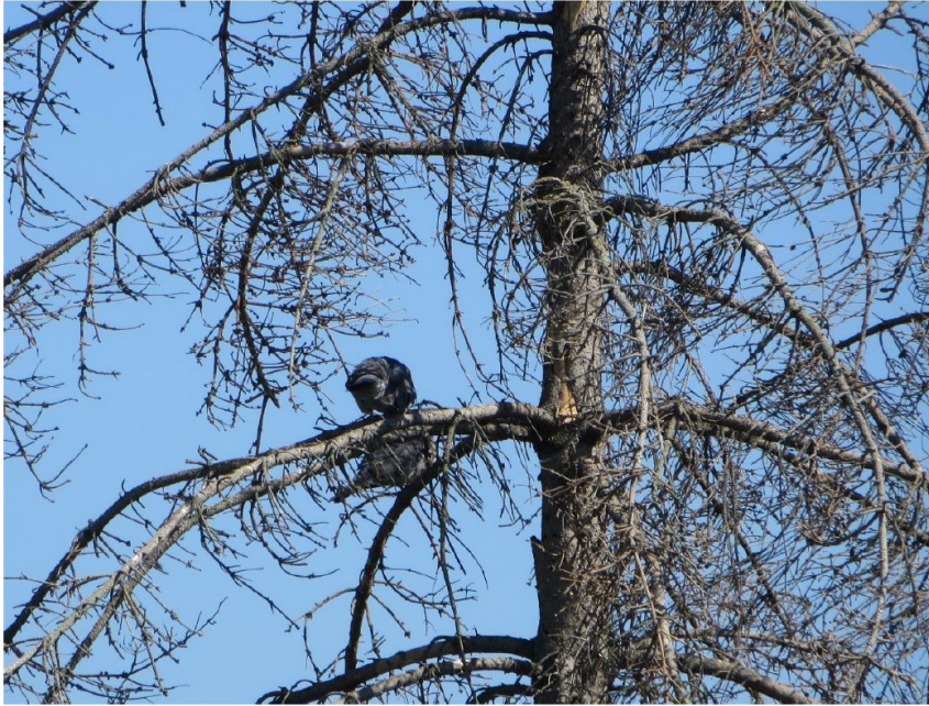
Abb. 5: Ringeltauben, der Baum steht leicht östlich außerhalb des UG, ein Neststandort ist in einer nah stehenden Kiefer

Ringeltaube ( Columba palumbus ) BV mit 2 - 3 BP im Gebiet bzw. in nahen Randbereichen