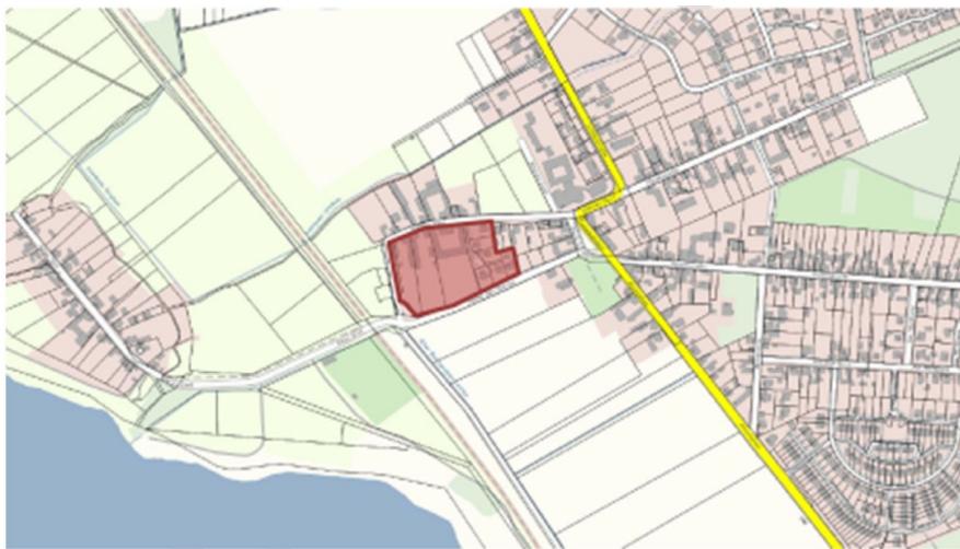
Abb. 1: Untersuchungsgebiet am Westrand von Lostau

Das Untersuchungsgebiet befindet sich am westlichen Ortsrand von Lostau und wird von den Straßen „Kleines Dorf“ und „Hinter den Gärten“ umfasst (Abb. 1).